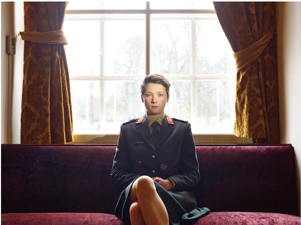
Académie Royale Militaire de Breda, Pays-Bas. Série Cadets

Paolo Verzone est représenté par l'Agence VU'.