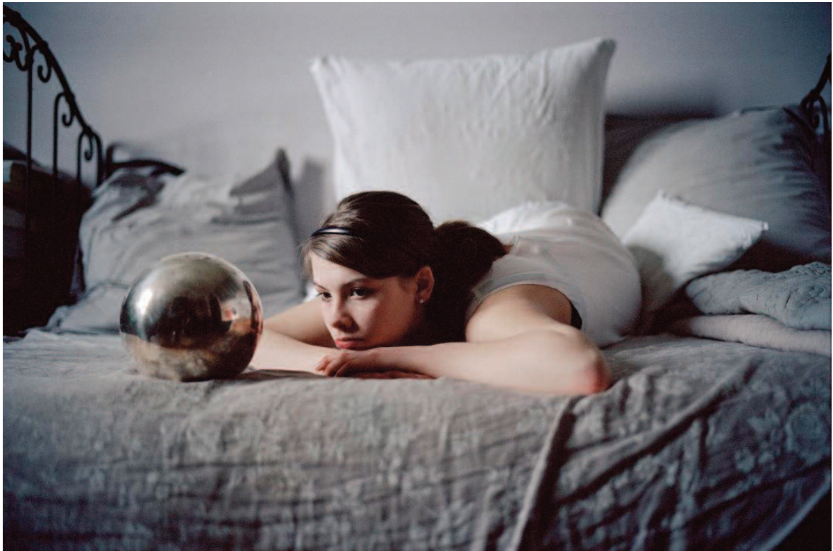
La boule de cristal, 2008. Série Sasha

Claudine Doury est représentée par l'agence VU' et par la galerie in camera, Paris.