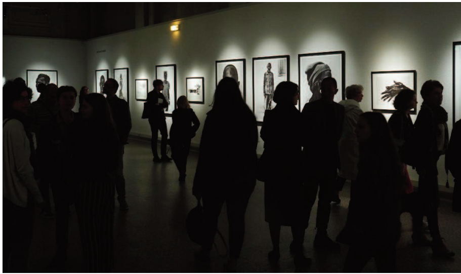
Portrait(s) Festival Vichy, Centre Culturel, 2019.

19H : Vernissage de l'exposition de Charles Fréger sur l'Esplanade du Lac d'Allier