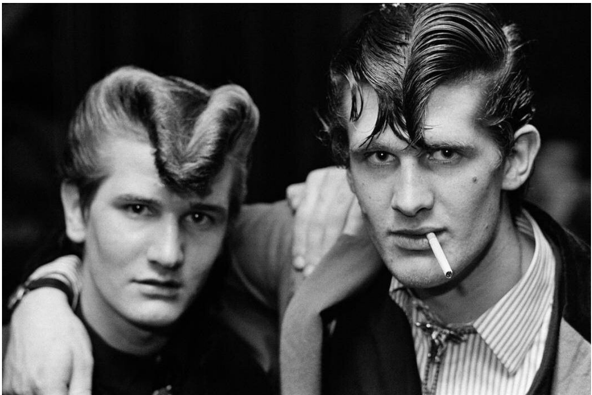
Red Deer, Croydon, 1976. Série The Teds

Chris Steele-Perkins est représenté par l'agence Magnum Photos.