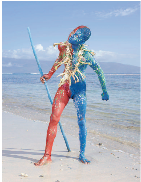
Pintao, Barahona, République Dominicaine, série Cimarron, 2014-2018