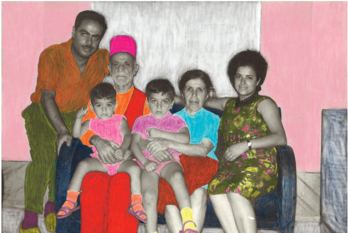
Sans titre, 2019. Série L'Amour se porte autour du cou

L'artiste et réalisatrice franco-libanaise Rima Samman collecte depuis des années les photographies anciennes des membres de sa famille, dont la plupart sont dispersés dans le monde. Elle recolorise les images à la main, masquant la nostalgie et le sentiment d'éloignement par un geste artistique et réunificateur qui consiste à parer de couleurs pop une mémoire conservée en noir et blanc. En transformant ainsi ses archives familiales, par le biais d'interventions sur les photos mais aussi d'un montage vidéo qui les met en mouvement, elle questionne avec une ambivalence joyeuse notre penchant à réinventer et à fantasmer nos identités et nos origines.