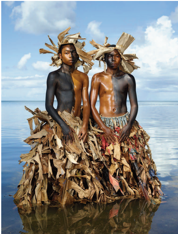
Mas a terre, Baie-Mahault, Guadeloupe, France, série Cimarron, 2014-2018

Ouverture au public le vendredi 17 juillet 2020.