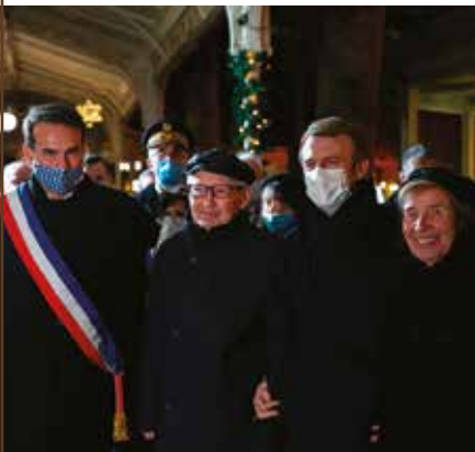
Séquence mémorielle en présence des époux Klarsfeld

« Cette histoire ce n'est pas à Vichy seule de la porter, c'est l'histoire de la France. Et en effet c'est ce régime de l'État français qui a décidé de collaborer avec l'occupant. Et je pense qu'il faut aussi qu'on accompagne la ville de Vichy dans les combats qui sont les siens pour son avenir. »