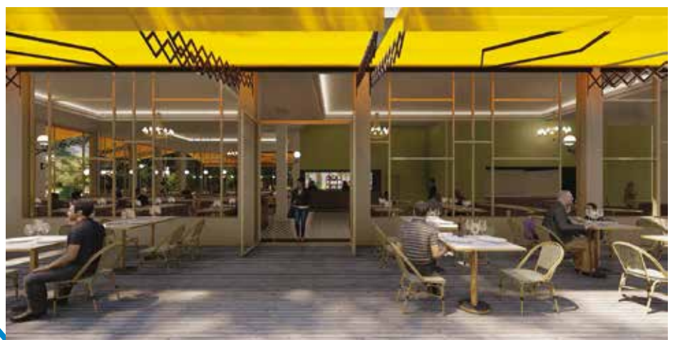
RÉNOVATION DU CASINO GRAND CAFÉ – GROUPE PARTOUCHE