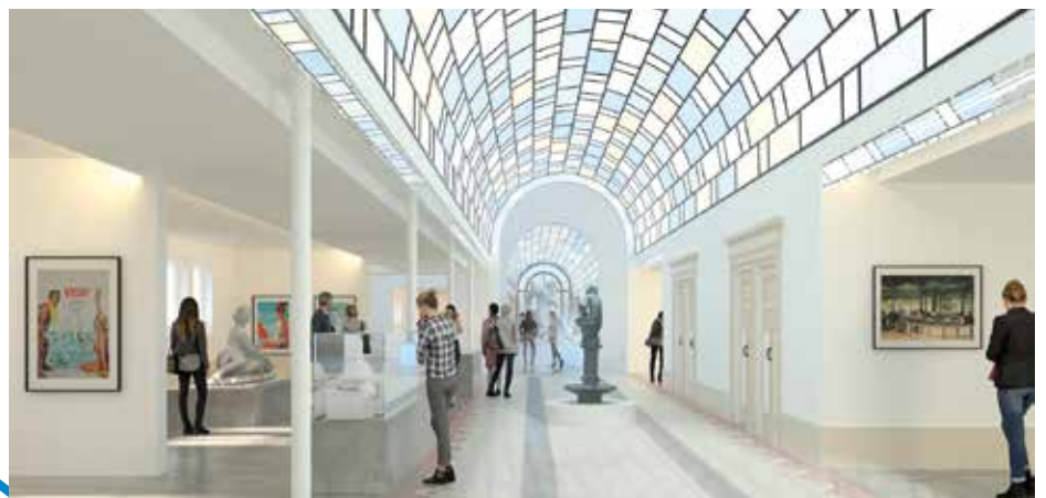
2 ÈME ÉTAPE DU PROJET MUSÉE DE VICHY ET RÉNOVATION DU HALL DES SOURCES

De 2022 à 2030, ce sont plus de 120 millions d'euros qui seront investis par la Ville et ses partenaires. Tour d'horizon des transformations à venir !