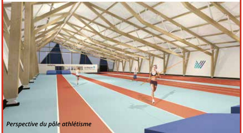
Perspective du pôle athlétisme

Dans un écrin de verdure, le Parc Omnisports s'étend sur 350 m 2 , offrant un plateau sportif riche et varié. Sont pratiqués des disciplines aquatiques, nautiques, indoor et outdoor. Afin de moderniser et compléter les équipements du plateau sportif pour faire de Vichy la destination de la performance sportive au niveau national et international, Vichy Communauté et la Région AURA ont investi dans des travaux d'envergure.