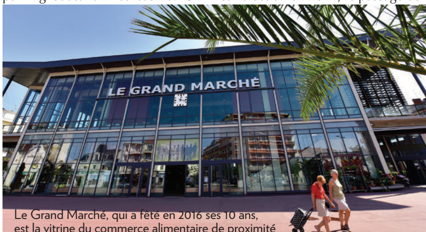
Le Grand Marché, qui a fêté en 2016 ses 10 ans, est la vitrine du commerce alimentaire de proximité

L'embellissement du centre-ville va se poursuivre. Dès l'automne la rue Wilson ( côté commerces ) sera rénovée en attendant la réfection complète du Parc des Sources que la Ville et ses partenaires espèrent racheter à l'État. La rénovation des passages est elle aussi à l'ordre du jour. Premier concerné, le passage de l'Opéra puis le passage Giboin ( eux aussi privés ) face à la place Saint-Louis. ■