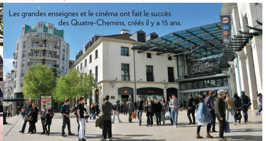
Les grandes enseignes et le cinéma ont fait le succès des Quatre-Chemins, créés il y a 15 ans.