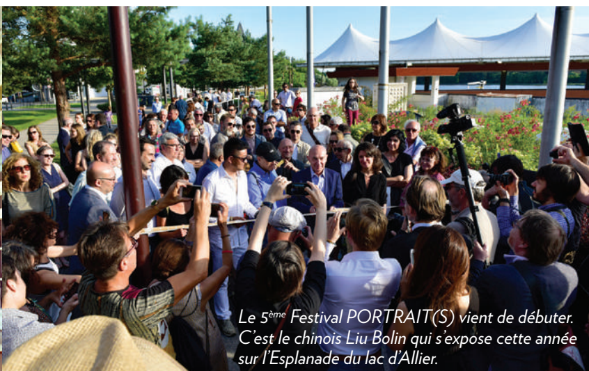
Le 5 ème Festival PORTRAIT(S) vient de débiter. C'est le chinois Liu Bolin qui s'expose cette année sur l'Esplanade du lac d'Allier.