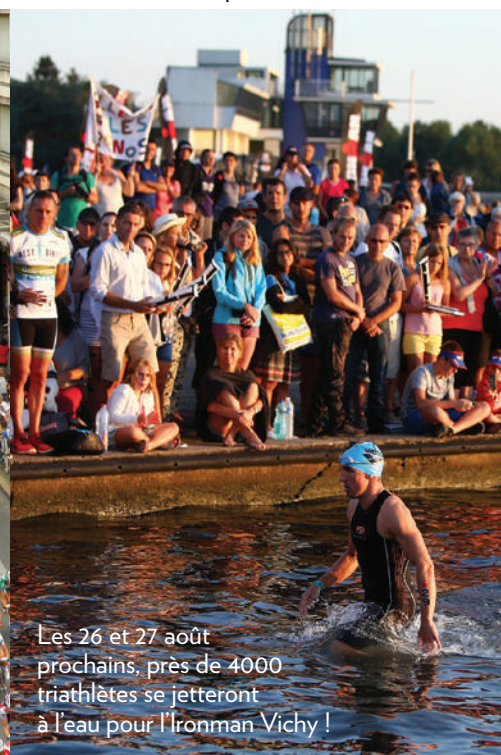
Les 26 et 27 août prochains, près de 4000 triathlètes se jeteront à l'eau pour l'Ironman Vichy !