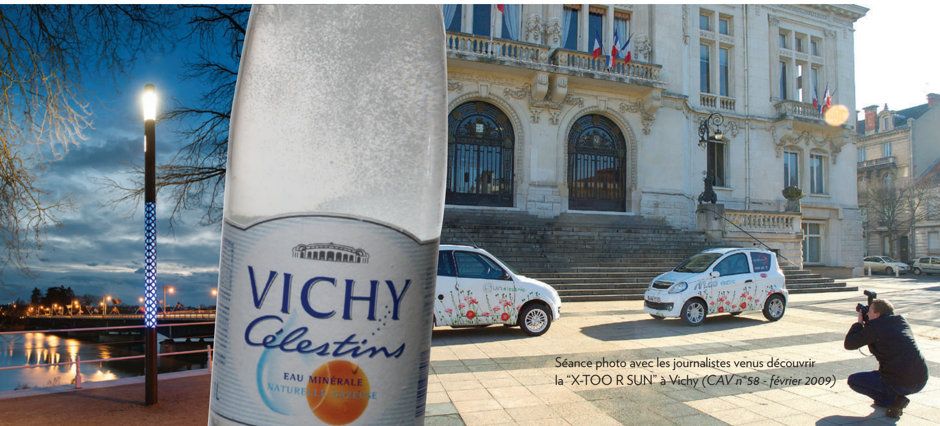
Séance photo avec les journalistes venus découvrir la "X-TOO R SUN" à Vichy (CAV n°58 - février 2009)

De grandes entreprises étrangères sont également implantées sur le territoire de l'agglomération, preuve du dynamisme du bassin et de sa capacité à accueillir. Sermeto passé sous la coupe de l'entreprise Valmont (États-Unis) fabrique à Charmeil (250 salariés) des candélabres qu'elle exporte sur les Promenades de la rive droite de l'Allier à Vichy et bien plus loin : à Doha au Qatar, l'autoroute d'accès à l'aéroport est éclairé par les immenses mâts made in Bourbonnais (CAV n°79). Plus récemment, en 2015, l'entreprise portugaise Renova , spécialiste du papier toilette et essuie-tout colorés, a installé à Saint-Yorre (sur le site de Candia ) sa première usine de production hors du Portugal, avec 30 salariés pour le moment (CAV n°91). Le magasin d'usine devrait ouvrir très prochainement et d'autres projets sont dans les cartons mais c'est top secret ! ■