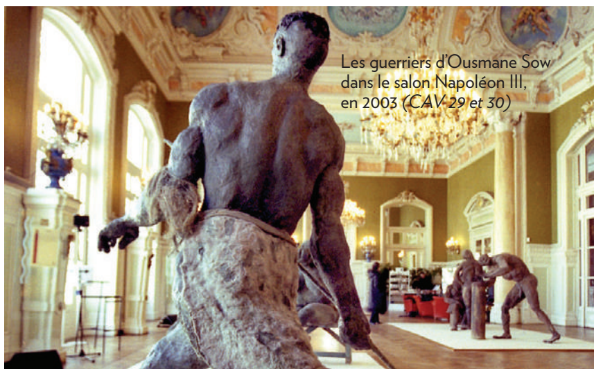
Les guerriers d'Ousmane Sow dans le salon Napoléon III, en 2003 (CAV 29 et 30)

S'arrêter là serait oublier les concerts de la Société musicale (CAV n°73), de l'Orchestre d'Harmonie (CAV n°97), du Conservatoire ou du Vichy Jazz Band, les Happys hours, le travail de nos artistes qui nous donnent à voir dans de multiples lieux, les animations de la Médiathèque (CAV n°91), les expositions des musées et les nombreux tournages de films... qui ont émaillé les pages de ces 100 numéros. ■