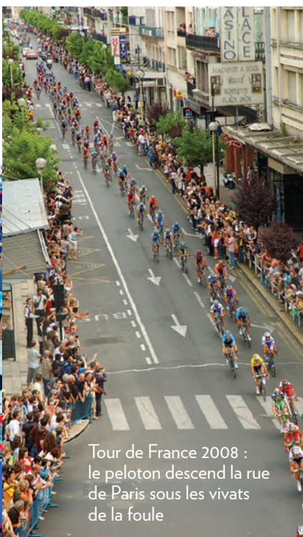
Tour de France 2008 : le peloton descend la rue de Paris sous les vivats de la foule